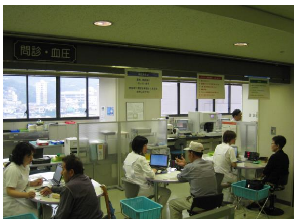
問診・血圧・採血