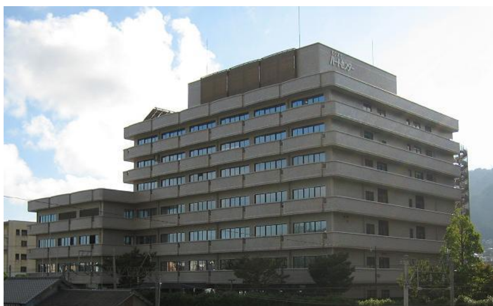
長崎市原子爆弾被爆者健康管理センター（6階、7階）

本協議会は、長崎市が茂里町に建設した「もりまちハートセンター」内の長崎市原子爆弾被爆者健康管理センター（6、7階）を拠点として、一般検査から精密検査、さらにはがん検診、あわせて健康指導に至るまで、被爆者の一貫した健康管理体制を確立し、コンピュータによる過去の検診データの集中管理や診断機器の整備を行うなどして健康診断の充実に努めている。なお、本協議会は平成18年4月より長崎市から「長崎市原子爆弾被爆者健康管理センター」の指定管理者として指定を受け、業務を行っている。