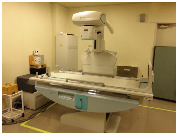
FPD搭載胃腸透視撮影装置 (胃がん検診用)