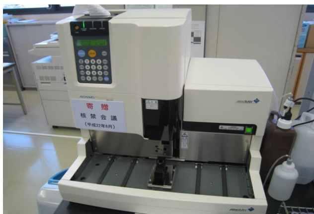
グルコース分析装置 (採血時血糖を測定)