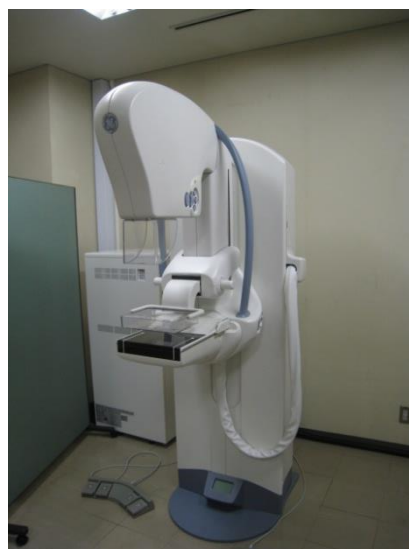
マンモグラフィー装置 (乳がん検診用)