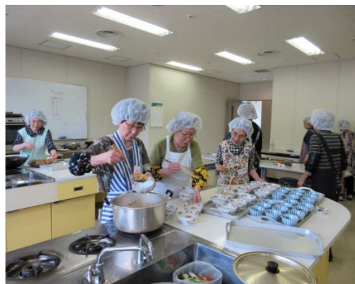
ボランティア(被爆者)による調理