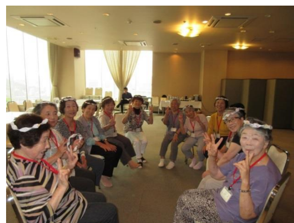
レクリエーション風景