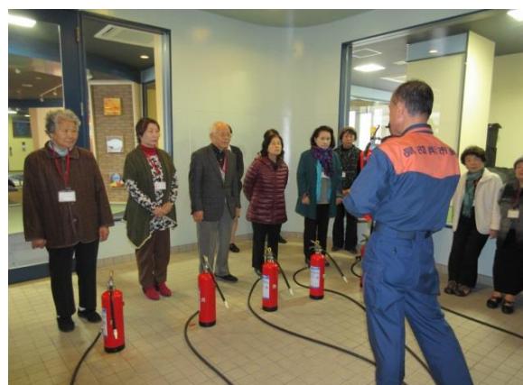
防災体験（中央消防署）