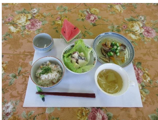
栄養士の献立で完成