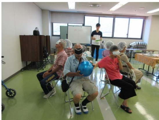
作業療法士による指導