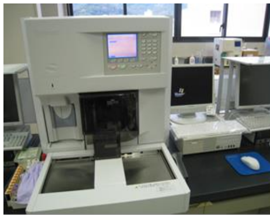
多項目自動血球分析装置 (赤血球数・白血球数を測定)