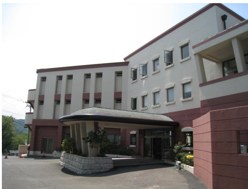
原爆被爆者温泉保養所「新大和荘」

しかし、建物の老朽化に伴い、平成22年8月31日で「大和荘」の営業を終了。長崎県市町村職員共済組合が隣接地に所有していた「旧グランビューうおみ」を購入・改装し、平成22年10月1日に「新大和荘」と名称を変更して新たに移転オープンした。