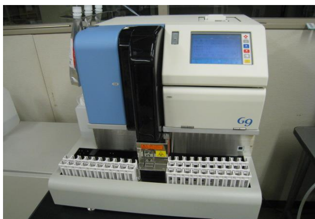
自動グリコヘモグロビン分析計 (ヘモグロビン A1c を測定)