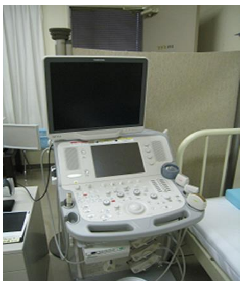
超音波検査装置 (エコー検査)