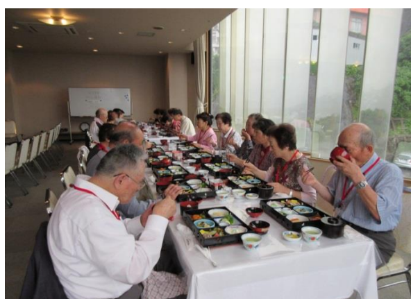
昼食（稲佐山温泉ホテルアマンディ）